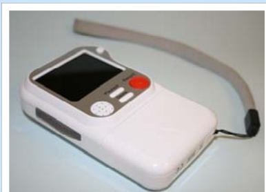
Camera fideo digidol 'Busbi'