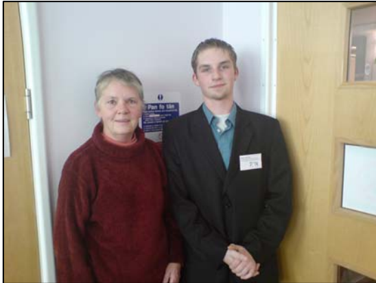
(Arweinydd y grŵp gyda Swyddog Prosiect Cyswllt Sir Gaerfyrddin)

Wedi gorffen y dasg hon, roedd yna gyfle i'r grŵp holi unrhyw gwestiynau ynghylch y dechnoleg a'r prosiect. Gwneir hyn i sicrhau bod pob aelod yn cael dealltwriaeth dda o'r dechnoleg a'r prosiect.