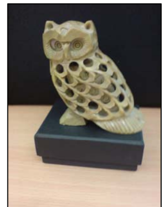
(Llun a gymerwyd ar ffon symudol wrth ymarfer)

Nod yr ymarfer hwn yw codi ymwybyddiaeth o'r ffordd y gellir defnyddio camerâu a fideos ffonau symudol er budd grwpiau, a thynnu sylw at y ffordd y gellir eu defnyddio i gynhyrchu deunyddiau ar gyfer blogio.