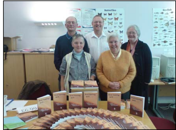
(Grŵp awduron Scribes R Us)

Mae 'Scribes R Us' yn grŵp o awduron creadigol sy'n seiliedig yn Nyffryn Aman Uchaf. Mae'r grŵp yn cwrdd yn rheolaidd i rannu straeon a hanes ac i drafod eu gwaith creadigol. Mae gan y grŵp dros ddeg o aelodau a, dros yr ychydig flynyddoedd diwethaf, mae eu gwaith wedi arwain at ryddhau pedwar llyfr byr sy'n dangos eu gwaith i eraill.